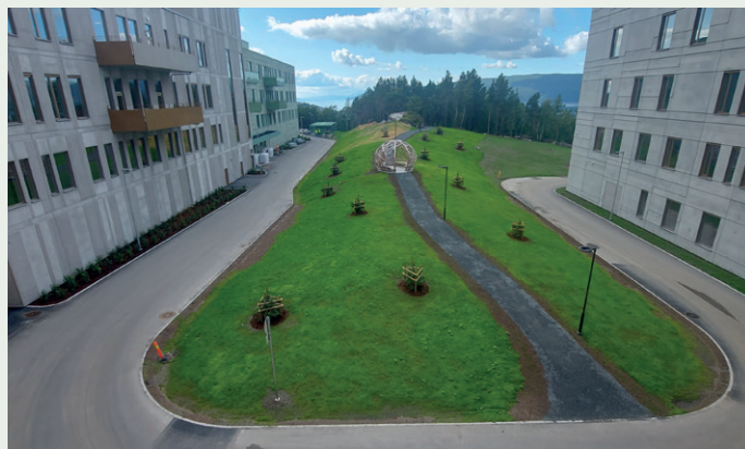
Prosjektet omfatter også et stort utomhusarbeid.