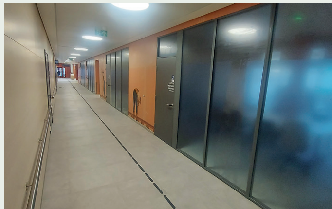
Å samle sykehus- og helsehusfunksjonene i Narvik skal sørge for at pasientenes behov er i sentrum og at man får mest mulig ut av helsepersonalet.

rom for fysio- og ergoterapi. Pasienten er i fokus i hele designet, og det lar også sykehuset og helsehuset få mest mulig ut av helsepersonalet. Uansett hvor mange sykehus vi bygger, vil det bli krevende å bemanne dem, så det er viktig at vi bygger mest mulig ef-