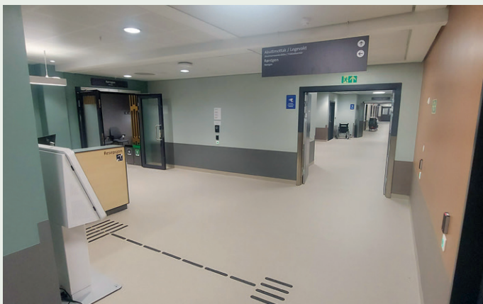
Nye Narvik sykehus skal samle behandlingstilbudene innen fysisk og psykisk helse i området.

av både statlig sykehus og kommunalt helsehus med to byggherrer og én entreprenør.