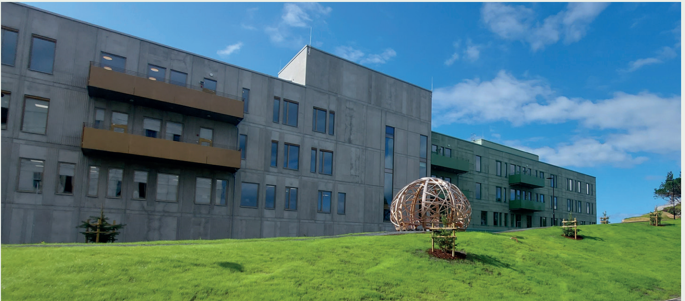
Arkitekt for sykehuset og helsehuset er Arkitema.

med tanke på den høye kompleksiteten. Det har vært høy kompetanse på alle sider av bordet, og vi har vært veldig fornøyde med denne måten å samarbeide på. Vi mener det er riktig vei å gå, sier Nilsen.