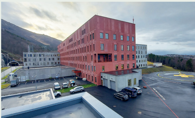
HENT har bygget for både Universitetssykehuset i Nord-Norge og Narvik kommune på Nye Narvik sykehus og helsehus.