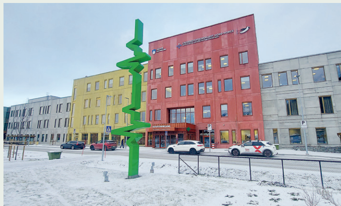
Utenfor hovedinngangen står kunstinstallasjonen Puls.