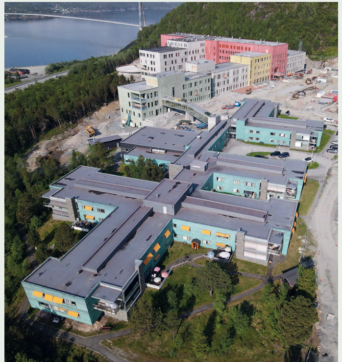
Det nye sykehuset og helsehuset er koblet sammen med Furumoen sykehjem og dagsenter med en lukket gangbru.