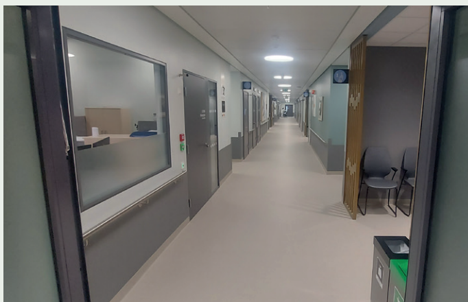
Nye Narvik sykehus er dimensjonert for 450 ansatte i daglig drift.