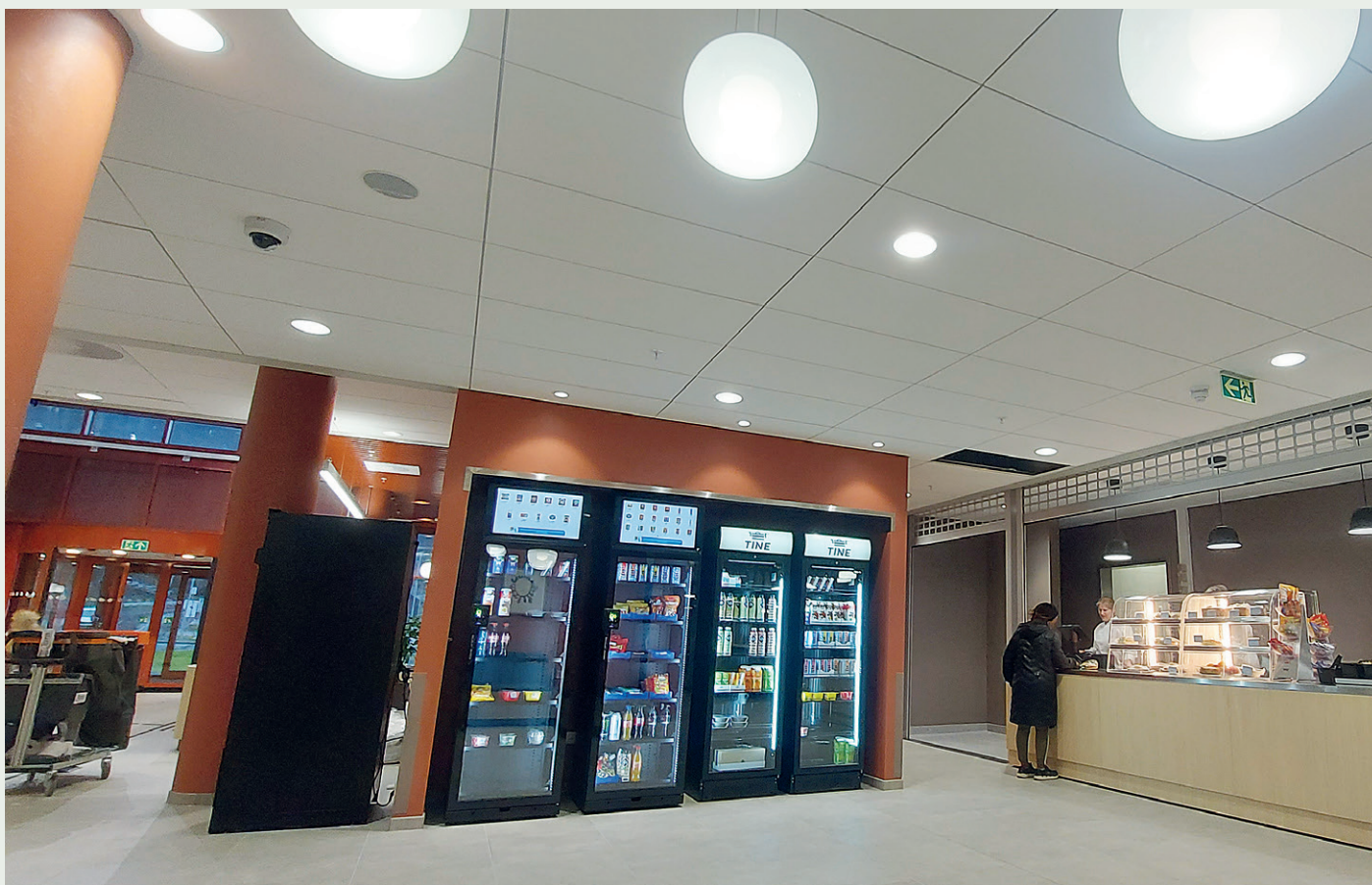
Sykehuset er omtrent 27.000 kvadratmeter stort.