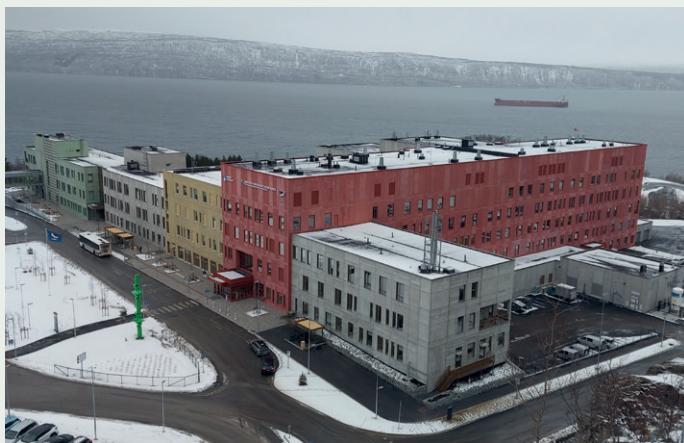
Bygget skal tåle et til tider værhardt miljø.

Noe som har vært temmelig unikt for det nordlige sykehusprosjektet, er den parallelle utbyggingen