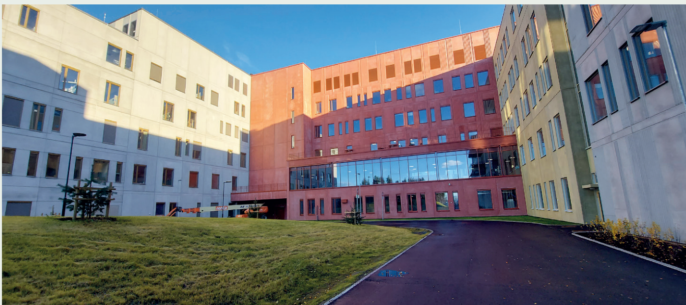
Fasadene i bygget skaper et fargerikt spill.