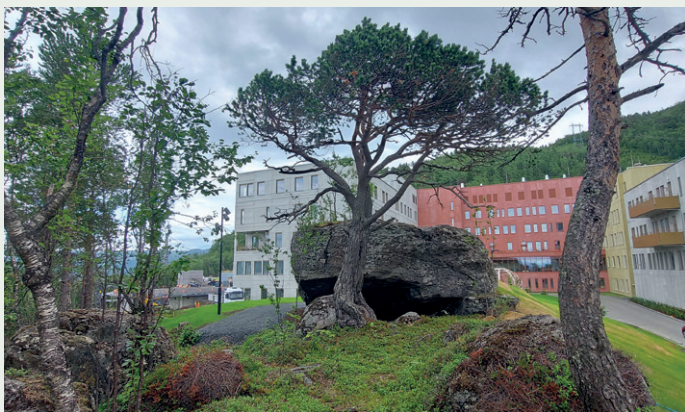
Byggene er omgitt av natur.